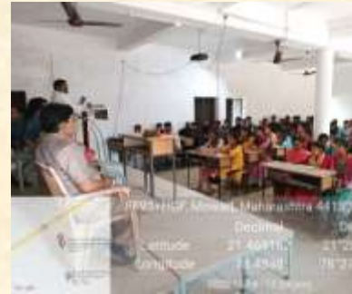
Skill Development workshop