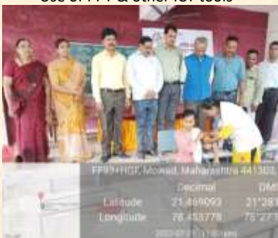
COVID-19 Vaccination camp