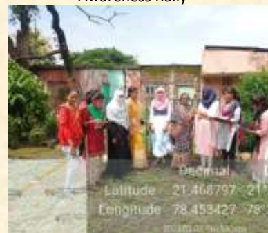
Case study survey