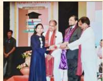
Gold Medal in Economics