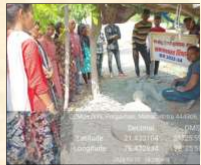
Field Visit under Sociology