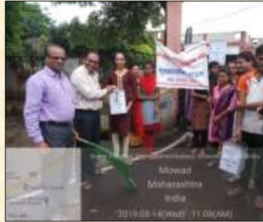
Flood Relief campaign