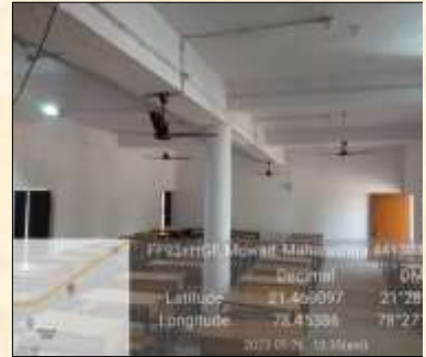
Spacious class rooms