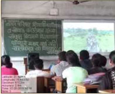
Disaster Management workshop