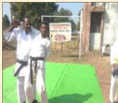
Self Defence workshop