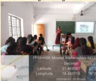
Use of PPT & other ICT tools