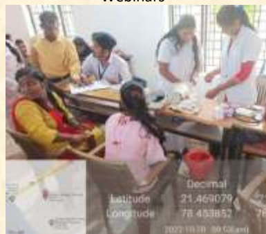
Women's Health Check-up camp