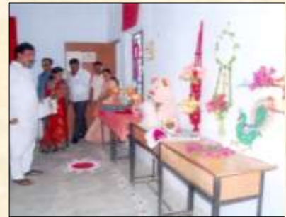
Arts & Crafts Exhibition