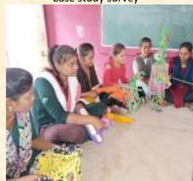
Arts & Crafts making