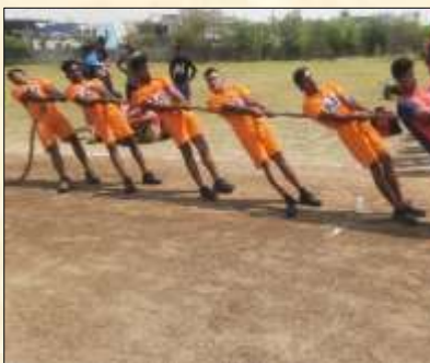
Tug of War sports Competition