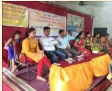
Mahila Bachat Gat workshop