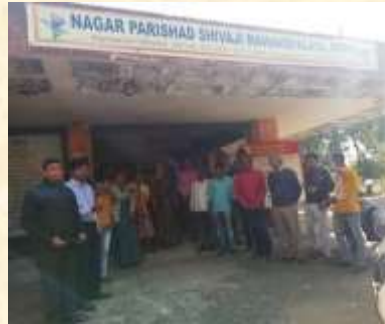
RTMNU BOS Election victory