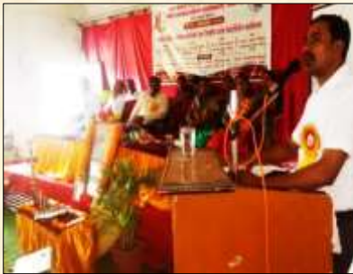
Competitive exam workshop